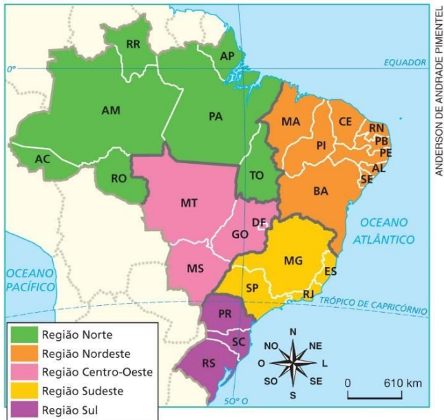
Brasil: Macrorregiões Geoeconômicas Pedro Pinchas