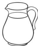
Jarra com suco